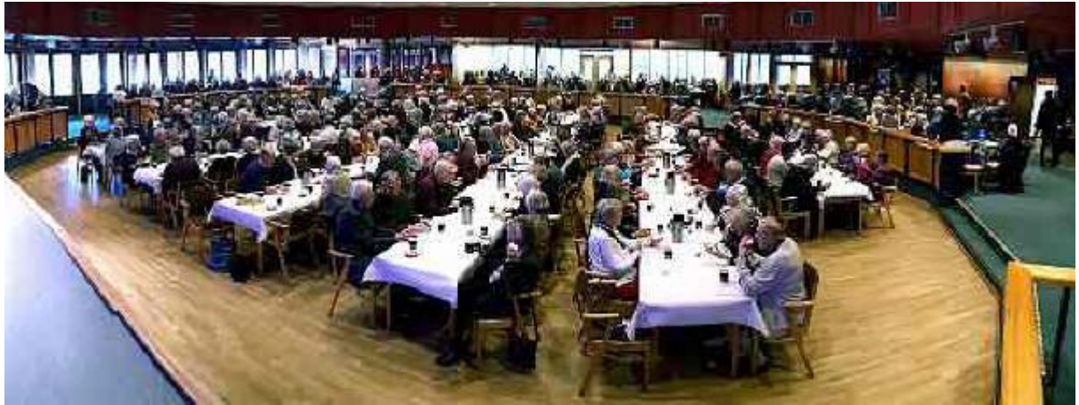
Publiken i parkhallen