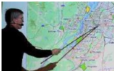
Senaste översiktsplanen från 2018