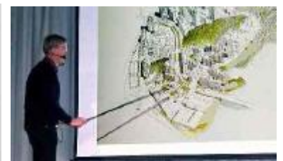
Nytt bostadsområde i Vårvik