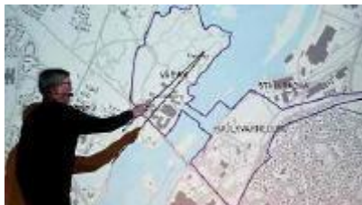
Nytt bostadsområde i Vårvik