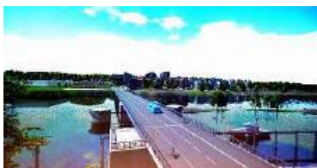
Förslag till nya bron över älven.