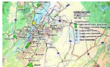
Senaste översiktsplanen från 2018