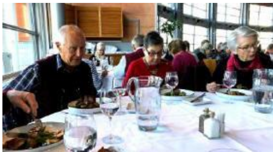
Vår lunch smakar gott på Operabaren.