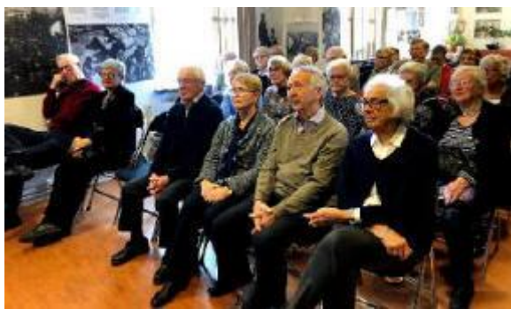
Här lyssnar vi på vår guide.