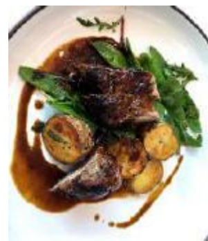
Sotad ekologisk fläskfile' med dagens tillbehör, salladsbuffe', bröd och kaffe.