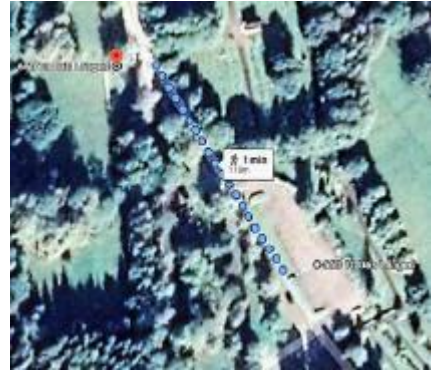
Klicka på kartan för att starta vägvisning i Google maps från parkering till startpunkten för vandringsleden.